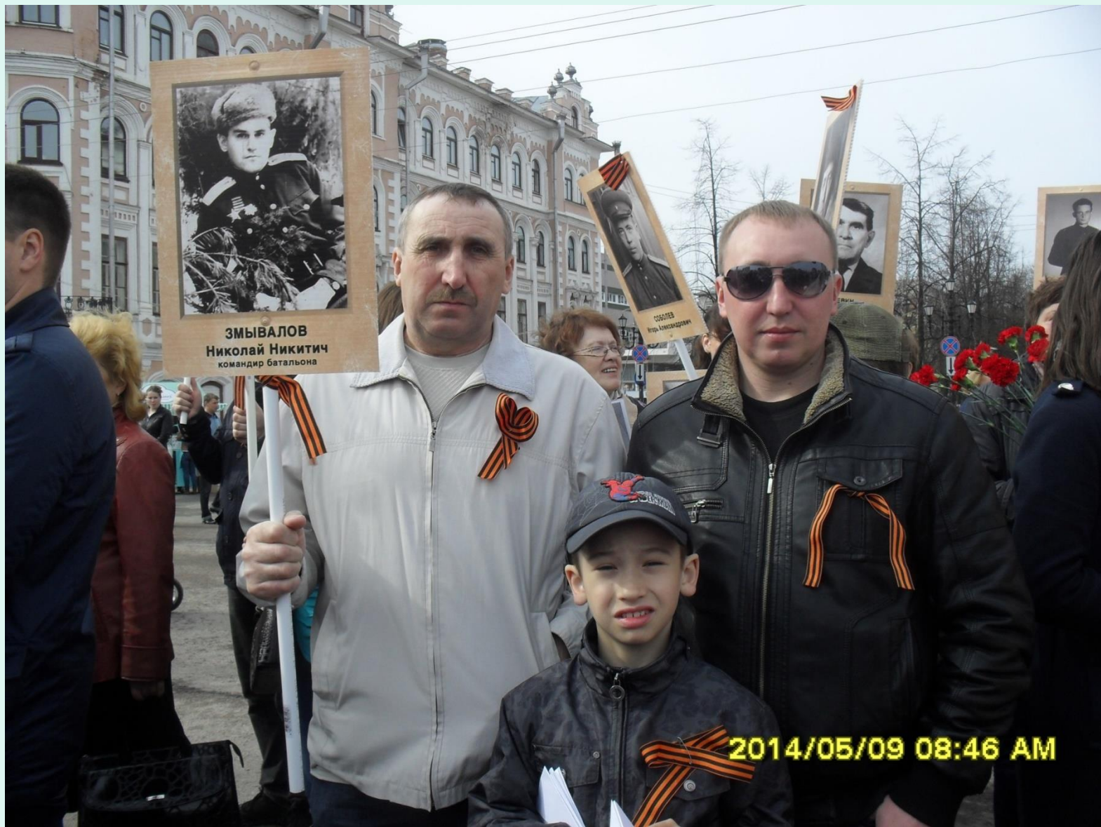
Бессмертный полк Змываловых: отец – сын – внук - правнук